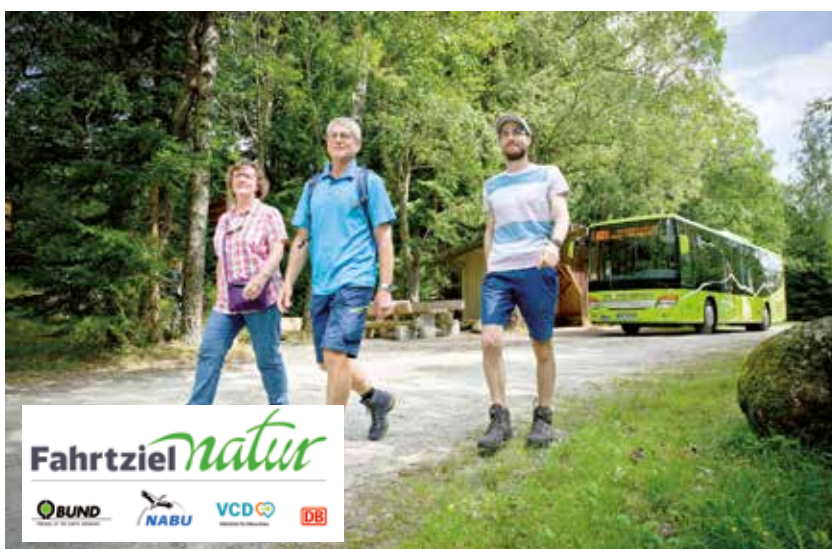
Im Nationalpark Bayerischer Wald gibt es kostenlose Busse für Wanderer.

Besucher:innen können erleben, wie der Wald seinen eigenen Weg geht, nicht vorhersehbar und vielfältiger als vorstellbar. Windwurf und Schneebruch, Borkenkäfer, Luchs und Wolf, Zunderschwamm und Zusammenbruch – all dies ist Teil der Wildnis. Umschlossen wird der Nationalpark vom Naturpark Bayerischer Wald – gemeinsam ist man Fahrtziel-Natur-Gebiet. Mit dem GUTi, dem Gästeservice Umwelt-Ticket, bietet die Region ein für Urlauber:innen kostenloses Bus- und Bahnnetz.